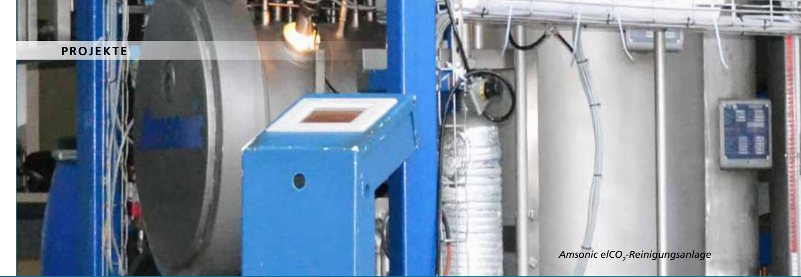
Amsonic elCO 2 -Reinigungsanlage