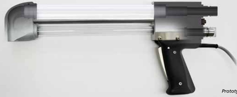
Prototyp der Umlenkdüse