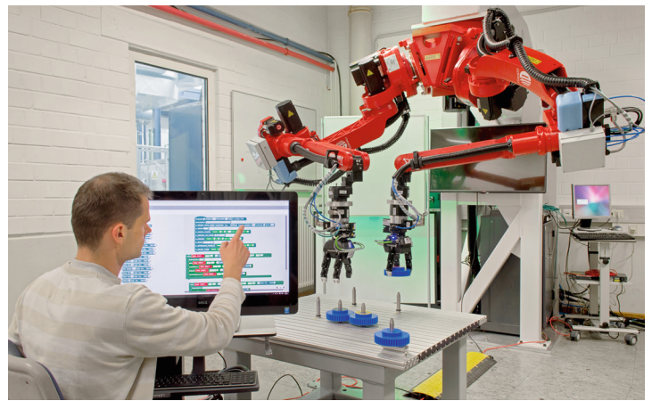
Ausführung einer Fertigungsaufgabe mithilfe der SCRATCH-Programmierungsumgebung und des IPK RP-i3 Framework

Erhöhung der Flexibilität in der Automatisierung durch einfache Implementierung von Roboteraufgaben ohne spezifische Programmierkenntnisse